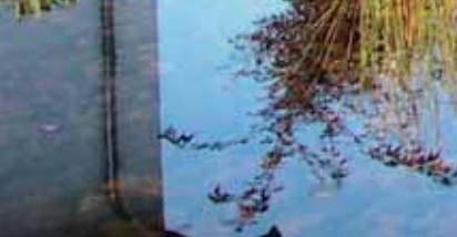
Xhoffraix, maison privée, arch. Luc Nelles