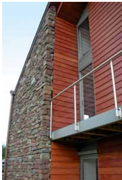
Chaîneux, maison privée, arch. V. Salmon