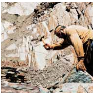
Refracteur de moellons