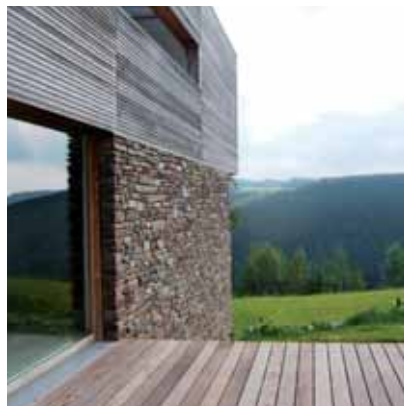
Chôdes, maison privée, arch. www.ccbajajmaignac.com