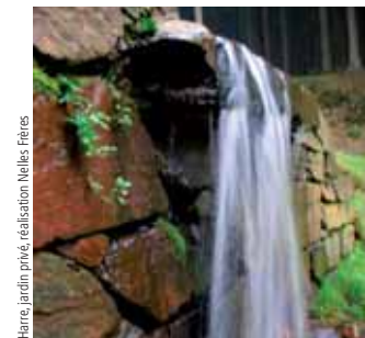
Harre, jardin privé, réalisation Nelles Frères