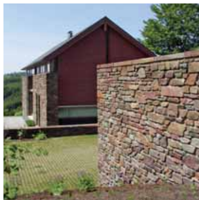
Xhofferix, maison privée, arch. L. Nelles