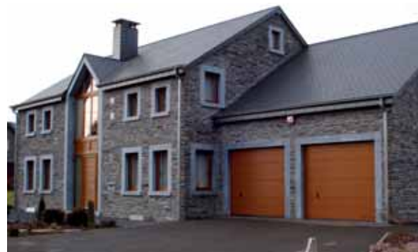
Bercieux-Vielsalm, maison privée

«Schiste fins, compacts, de couleur [à préciser], d'âge stratigraphique Ordovicien (Primaire)».